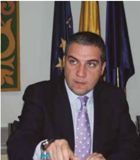
Elias Bendodo seguirá presidiendo la Diputación de Málaga.