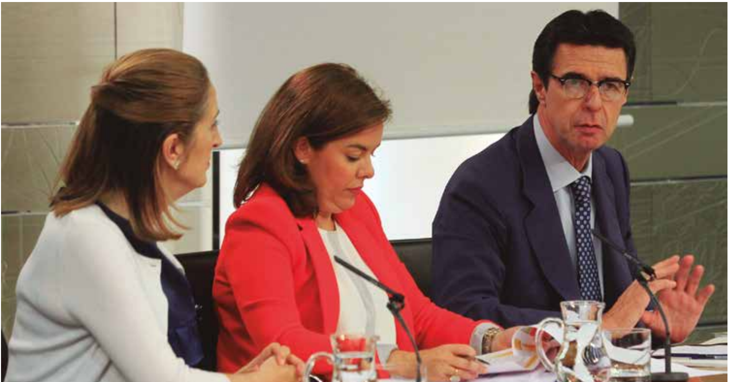
Rueda de prensa tras en el Consejo de Ministros en el que se aprobaron las ayudas.

A la primera convocatoria sólo podían presentarse entidades de las comunidades de Andalucía, Castilla-La Mancha y Extremadura por limitación de presupuestos del FEDER. Se recibieron un total de 37 iniciativas candidatas, de las que 14 quedaron seleccionadas.