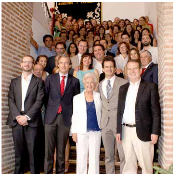
El Presidente de la FEMP entrega la Llave de Oro a la viuda de Pedro Aparicio, en presencia de su hijo. En la otra imagen, con la Junta de Gobierno y empleados de la Federación que también acudieron al homenaje.

En este sentido, De la Serna destacó que su labor, junto con el resto de Alcaldes que constituyeron la FEMP, “fue vital para llevar a cabo uno de los trabajos más importantes de la democracia: definir y defender los intereses de los municipios y provincias de España” .