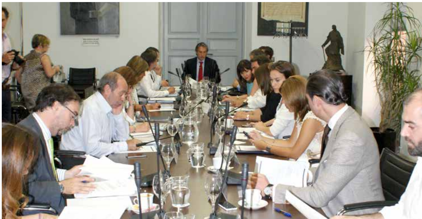
Reunión de la Junta de Gobierno el pasado 14 de julio.

Buena prueba de ello es la creación en 2014 de la Central de Contratación de la FEMP, que en tan sólo un año ya cuenta con 490 Entidades Locales adheridas que representan a más de 17 millones de habitantes; contratos ya formalizados de combustible para calefacción y de asistencia para la gestión de multas de tráfico; cinco acuerdos marco en funcionamiento (suministro de combustible para calefacción, asistencia para la gestión de multas de tráfico, suministro de electricidad, suministro de combustible automoción para Canarias, Ceuta y Melilla, suministro de gas natural), y dos acuerdos marco en licitación (asistencia para la gestión tributaria en vía ejecutiva y prevención de riesgos laborales).