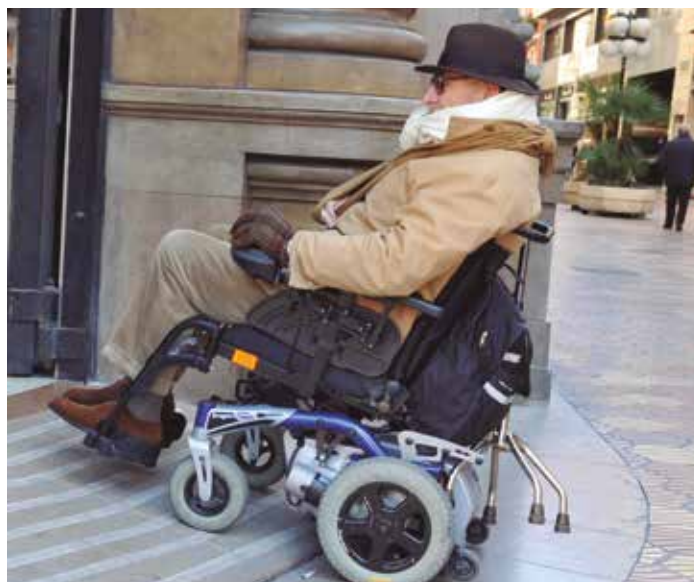
La ordenanza ayudará a los municipios a adecuar su normativa también en materia de accesibilidad a edificios.

En un segundo nivel, el deber de conservación incluye los trabajos y obras necesarios para adaptar y actualizar progresivamente las edificaciones, en particular las instalaciones, a las normas legales que les vayan siendo explícitamente exigibles en cada momento.