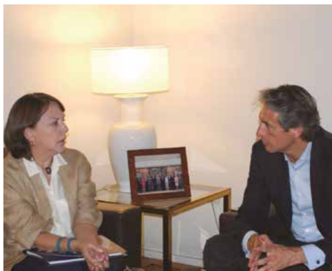
La esposa del Alcalde de Caracas durante su reunión con el Presidente de la FEMP.