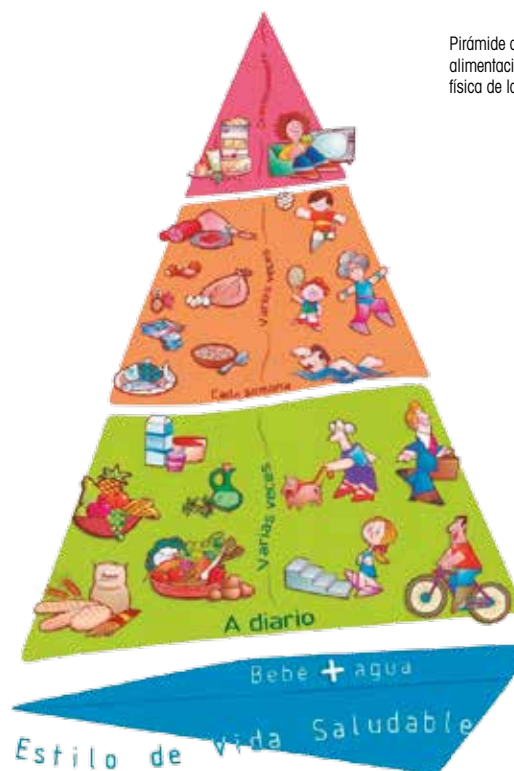
Pirámide doble de alimentación y actividad física de la Estrategia NAOS

Las categorías de los galardones Estrategia NAOS son las siguientes: A la promoción de una ali-