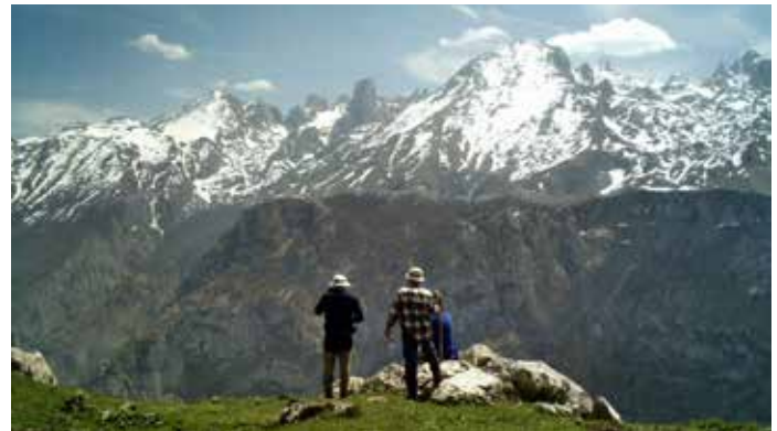
Parque Nacional de los Picos de Europa.

También se han adjudicado fondos a proyectos de prevención de daños a la ganadería por parte de grandes carnívoros. Serán beneficiarias de la partida presupuestaria aquellas CCAA en cuyo territorio se localice el área de distribución de grandes predadores, oso pardo, lobo y lince ibérico, y se justifique la existencia de daños sobre aprovechamientos ganaderos.