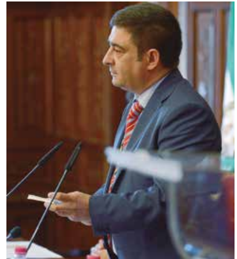
Francisco Reyes seguirá cuatro años más al frente de la Diputación de Jaén.