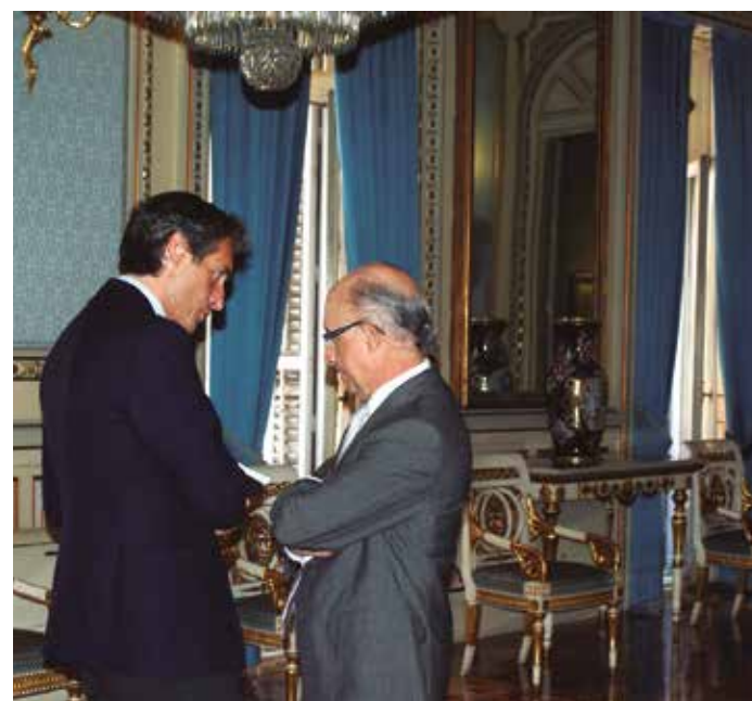
Antes de la reunión (foto superior) el Ministro y el Presidente de la FEMP mantuvieron un breve encuentro (abajo).