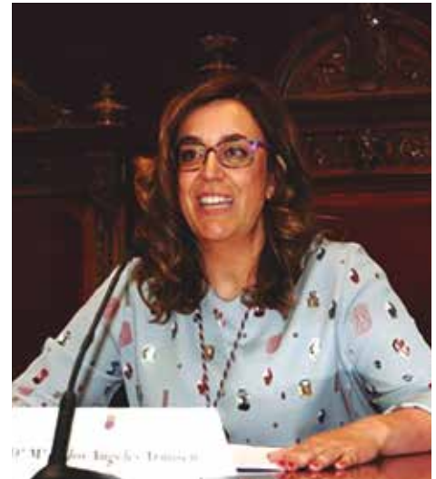
Ángeles Armisen debuta como Presidenta de la Diputación de Palencia.