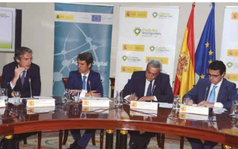
Momento de la constitución del Foro el pasado 10 de julio en Madrid.

Actualmente, la RECI está formada por 62 ciudades: A Coruña, Albacete, Alcalá de Henares, Alcobendas, Alcorcón, Alicante, Almería, Alzira, Aranjuez, Arganda del Rey, Ávila, Badajoz, Barcelona, Burgos, Cáceres, Castellón, Ciudad Real, Córdoba, Guadalajara, Elche, Fuengirola, Getafe, Gijón, L'Hospitalet de Llobregat, Huelva, Jaén, Las Palmas de Gran Canaria, Logroño, Lugo, Huesca, Madrid, Majadahonda, Málaga, Marbella, Mérida, Molina de Segura, Móstoles, Motril, Murcia, Oviedo, Palencia, Palma de Mallorca, Pamplona, Paterna, Ponferrada, Pozuelo de Alarcón, Rivas Vaciamadrid, Sabadell, Salamanca, Sant Cugat, Santa Cruz de Tenerife, Santander, Santiago de Compostela, Segovia, Sevilla, Tarragona, Torrejón de Ardoz, Torrent, Valencia, Valladolid, Vitoria-Gasteiz y Zaragoza. ★