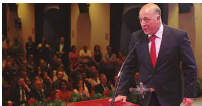
Antonio Ruiz jura su cargo de Presidente de la Diputación de Córdoba.